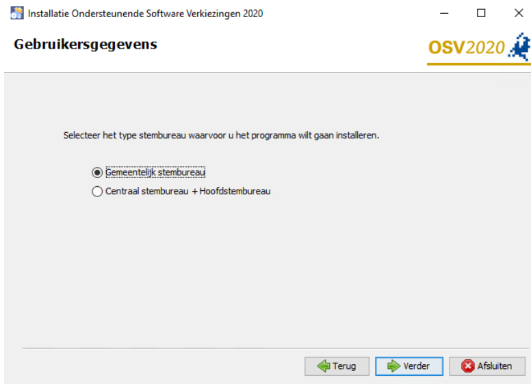
Figuur 1 Provinciale Staten (1 kieskring)- en Waterschapverkiezing

U dient bij de installatie het juiste stembureau niveau voor Gemeentelijk stembureau te kiezen: